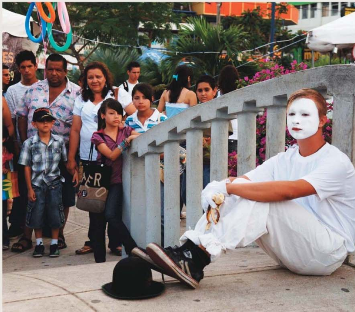
¡Ey, usted, el de blanco! Un mimo de Fantazz-Tico fascinó ayer a los generaleños que lo seguían y le prestaban atención a cualquier movimiento. EDDY ROJAS

En mayo, el Circo Fantazz-Tico comenzará una gira de un mes por Europa . Esta agrupación es una escuela para niños y jóvenes de barrios marginales que ofrece muchas risas, malabares, acrobacias, teatro, mimo y magia a sus espectadores